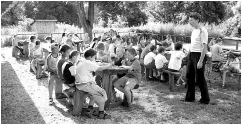
A tábor udvarán