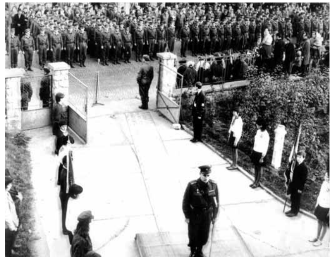
Hazaérkezés Fogadás a pártbizottság (ma alsós iskola) előtt