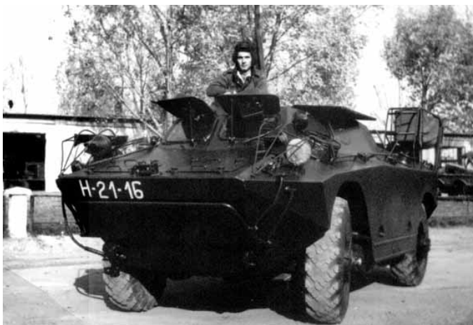
Felderítő a járműben