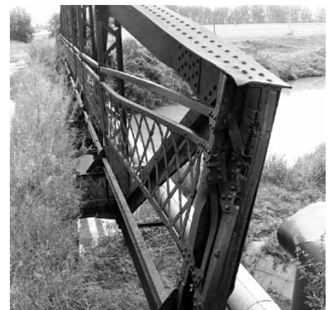
A tompai hvd ma is magán viseli a kivonulás nyomait