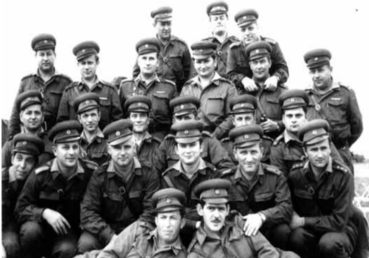
Rétsági tisztikar Léván

Az első hetekben feszült volt a helyzet. Sokan nem tudták, hogy miért is jöttek be a magyar katonák. Az idősebbek azt hitték, hogy a Felvidék ismét visszatér az anyaországhoz, de sok helyütt jellemző volt a tüntetés, a néma ellenállás. Feliratok jelentek meg a falakon és az úttesteiken, melyek a szovjet és magyar katonák kivonását követelték, s röplapokat osztottak. A Léván állomásozó ezred járőröket szervezett a környező településekre, s így sok helyen tapasztalták a nyugtalanságot. "Kimondottan ellenforradalmi fellépésre nem került sor. Az időszakos harangozás, dudálás, szirénázások, munkabeszüntetések és egy alkalommal 25 perc időtartam-