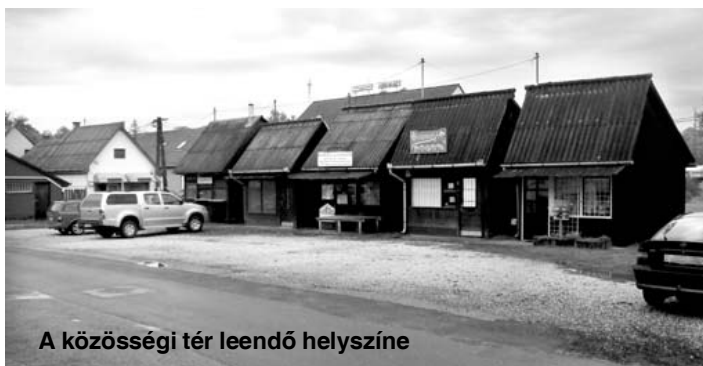
A közösségi tér leendő helyszíne

- A képviselő-testület már korábban, megfelelő pályázattal után döntött a köz- beszerzéseket lebonyolító cég, a projekt- menedzser, a könyvvizsgáló, a jogi ta- nácsadó és a műszaki ellenőr kiválasztá- sáról. A következő feladatunk a közbe- szerzési eljárások elindítása, ezek végén a kivitelező cégekkel való szerződéskötés, és a munkaterület átadása a kivitelezők számára. Ezek még az idén megtörténnek, s a munkáknak a tervezett végső befeje- zési határideje 2013. november 4. Na- gyon örülünk annak, hogy ebből a szinte reménytelen helyzetből sikerült végül is nyerni ezzel a pályázattal. Bízunk abban, hogy minden a tervek szerint halad majd, és a munkák is jó minőségben fognak el- készülni.