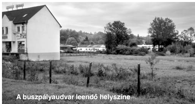
A buszpályaudvar leendő helyszíne